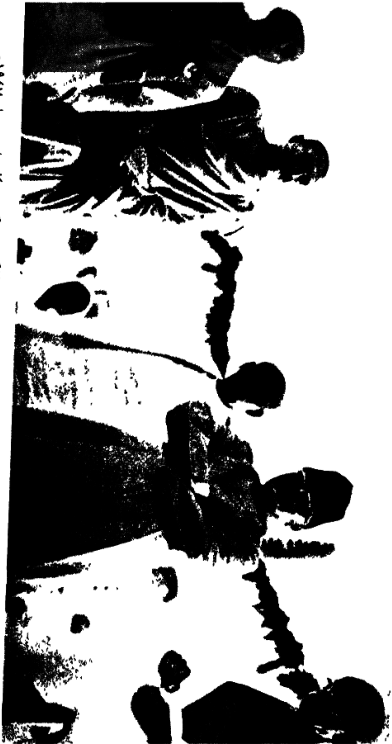
۱۹۴۷ء ۸۳۶۱ء حاکمہ، دیلی پہنت حی - دادساہ جان - سردار پتیل - مولانا اراد - مہاراجا حی ال اندیا کاکریس کمیٹی کا جلسہ، دیلی ۱۹۴۷ء