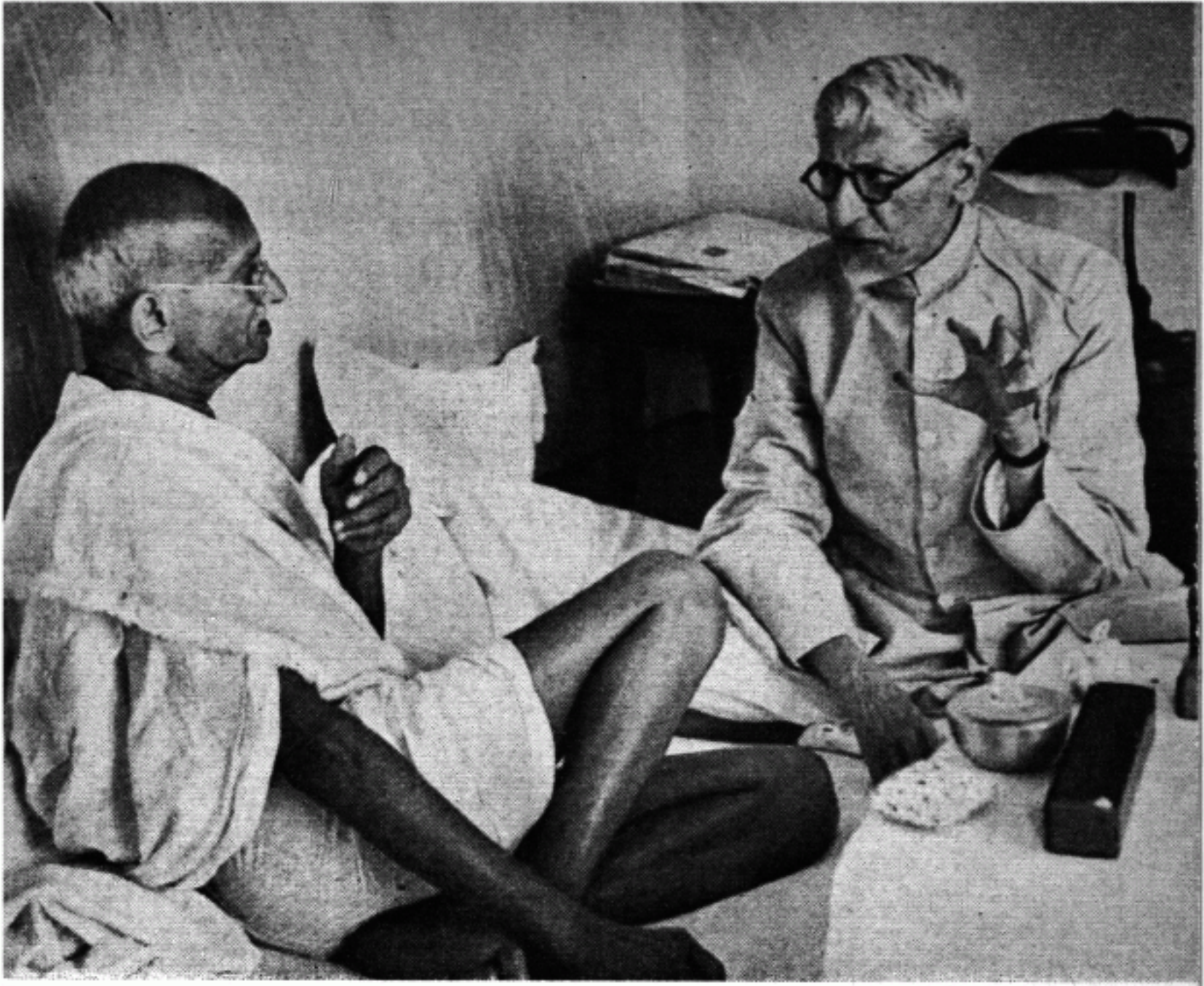
گاندھی جی اور مولانا ابوالکلام آزاد (۱۹۴۶ء)۔