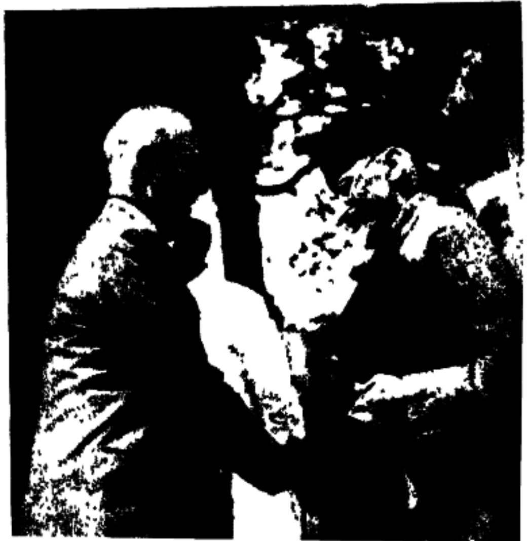
ہندوستان کے وائس رے انڈین نیشنل کانگریس کے صدر سے افتتاح کانفرنس کے موقع - مصافحہ کر رہے ہیں