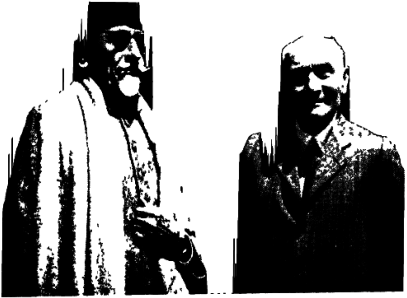
مولانا آزاد اور لارڈ پیتھک لارنس سے جماعتی کانفرنس کے موقع پر شملہ میں - ۵ مئی ۱۹۴۶ء